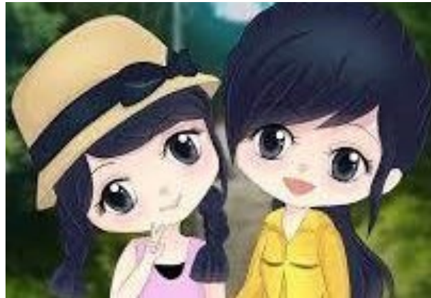
Một khi kẻ thù đã trở thành bạn thì sẽ là bạn đến suốt đời- Tục ngữ Trung Hoa cổ

Nhưng rồi đột nhiên, tính của bạn ấy thay đổi, trở nên thân thiện hơn rất nhiều. Thế nhưng, mình vẫn mang cái thành kiến trước đó và chẳng bao giờ thèm chơi với bạn ý cả. Năm lớp bảy, chúng mình được xếp ngồi cạnh nhau. Bạn ý đã giúp đỡ mình rất nhiều: Như khi mình mất tẩy bạn không ngại chia sẻ với mình cục tẩy của bạn hay khi mình ốm, bạn đã không ngại mà cho mình mượn vở một cách rất vô tư. Đặc biệt, có một lần mình bị cô trách oan nhưng trong lớp ai cũng sợ cô không dám hé răng nửa lời. Mình đã chắc chắn lần này chỉ có “đi” mà thôi. Chắc hẳn mình sẽ lại phải viết bản kiểm điểm, bị phạt trực nhật một tuần, vậy mà có một cánh tay giơ lên không trung. Mình thấy khá sốc khi đấy lại là bạn ấy. Bạn ấy đã minh oan cho mình, giúp mình thoát khỏi các hình phạt.