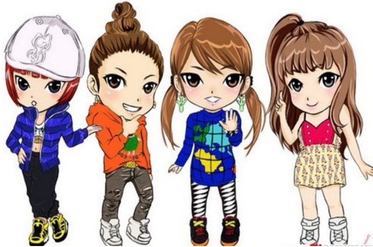
Tôi cố gắng thân với nhóm con gái hơn